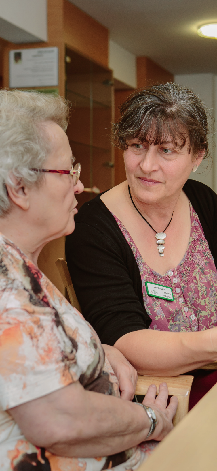
12/2020, Fotos: Patricia Kalisch, iStock; redmark